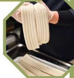
직접 뽑은 떡!

🌐 PŘÍDAVNÉ NUDLE 면 추가 (당면/라면/우동) 105 Kč 🌐 Batátové nudle / Ramen / Udon 1